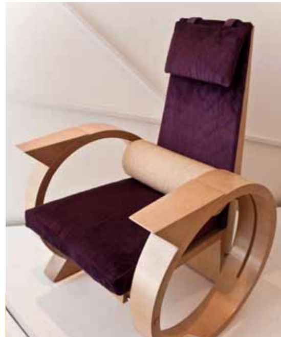
Même les bijoux et meubles biogéométriques protégeraient contre les effets nocifs des champs électromagnétiques.